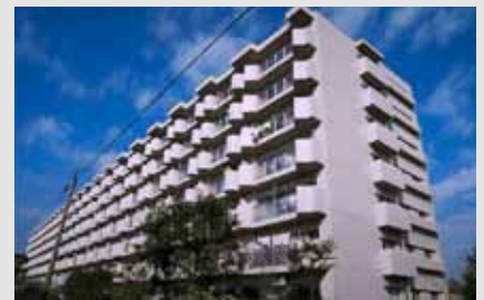
公社賃貸建替第1号「フロール新杉田」= H1 年度管理開始、横浜市磯子区