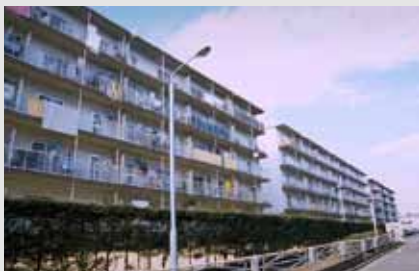
公社最多戸数賃貸「下九沢」= S46・47 年度管理開始、相模原市中央区