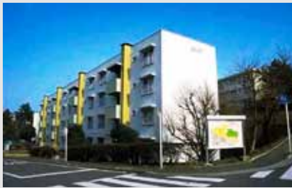
公社初の無電柱団地「汐見台」= S38-40 年度管理開始、横浜市磯子区