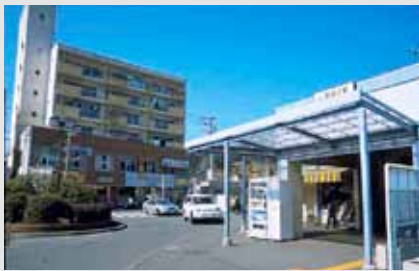
公社賃貸エレベーター第1号「東逗子駅前共同ビル」= S45 年度管理開始、逗子市