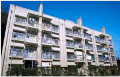
公社現役最長寿賃貸「大和町」= S26 年度管理開始、横浜市中区