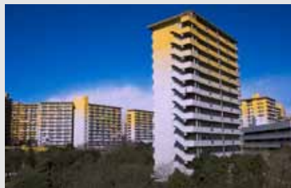
公社最大団地の中央にある「若葉台」= S58 年度管理開始、横浜市旭区