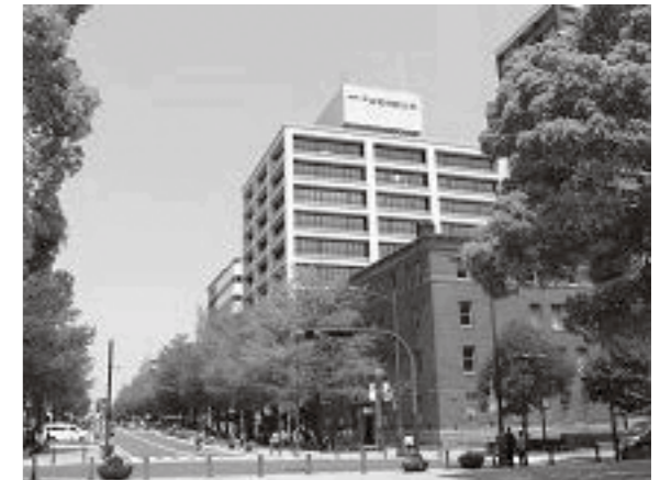
神奈川県住宅供給公社の素顔