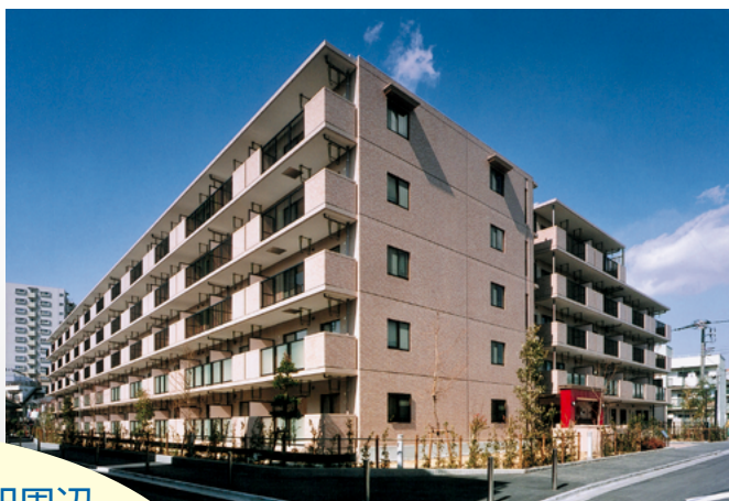
フロール川崎古市場