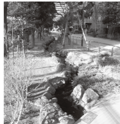
まちの一体的な整備により、二ヶ領用水・旧町田掘の川筋に、潤いあるせせらぎと遊歩道が復元、されています。