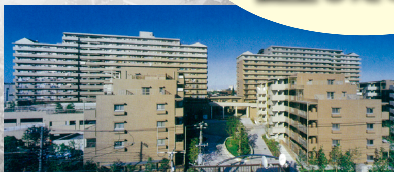
フロール川崎下平間