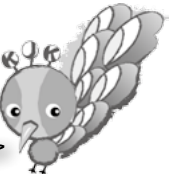
弟：プティ・レーヴ