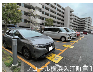
フロール横浜入江町第1

前回、令和3年度 居住者実態調査の 集計結果は、 「県公社のたより」第30号 (2022年5月9日発行)にて お知らせしています。