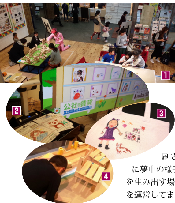
1 木工作会場 2 ファミリー向け参加型アトラクション「RICOH 公社オリジナル紙アプリ」 3 子供が描いた絵をその場でトートバックに印刷 4 木工作(椅子)