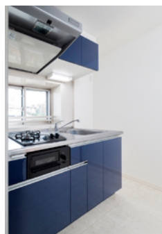
▲システムキッチン

白い壁紙にフローリング(杉無垢材)の床、押入はクローゼットに。現代的な内装にフルリノベーションされました。