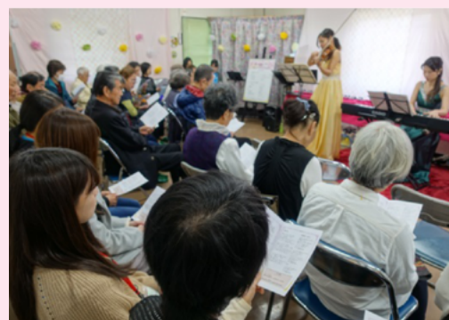
▲今年行われた団地コンサートでも、学生たちは企画や司会などで活躍。

このような状況の中で、「生涯賃貸」をコンセプトとする当公社は、2017年の春に浦賀団地（横須賀市浦上台）にて団地活性化サポーター制度を開始しました。この制度は、ご入居者の団地コミュニティへの参画機会を増やすことなどを目的に作られたもので、その最初の担い手となったのは、神奈川県立保健福祉大学の学生4名でした。ヒューマンサービスの実現を目指す同大学の学生らしく、この4名に共通していることは、「地域活動に参加し、人との関わり合いを大切にしたい」という思いです。