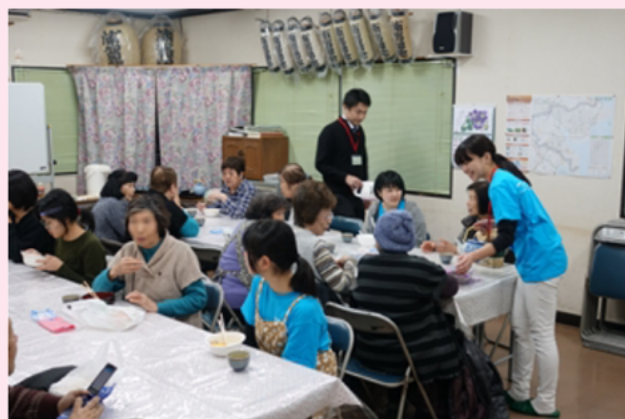
▲団地コミュニティに溶け込む学生（青いTシャツ着用）。

そんな学生たちによる自主的活動のひとつが、孤食対策として取り組んでいる「どんぶりの会」と呼ばれる食事会です。ある日のメニューは4色丼（左写真）、学生たちが作りました。20名のご入居者が参加し、皆さんおいしいと笑顔で完食。2年の歳月で、ご入居者と