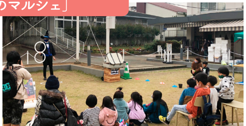
マジシャンによるパフォーマンスに釘付けになる子供たち (2020年11月7日)