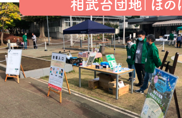
入場時のチェックを徹底しました