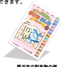
横浜市の配布物の例