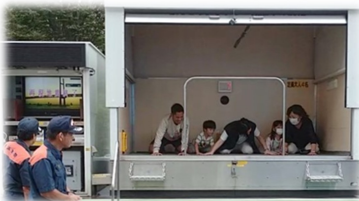
▲消防士さんに見守られ、子供たちも揺れを体験

この日はあいにくの雨模様でしたが、ご入居者のみなさま、横浜市消防局、磯子区役所、管理会社、