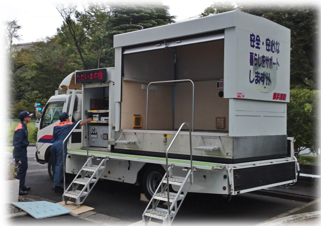
▲横浜市消防局の防災指導車 別名「起震車」