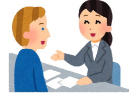
外国語版の例) ラオス語版

ມີ : ດ່ານຊີ ມີກິດຈະບຽບຖິ້ມຂີ້ເຫຍື້ອແຕ່ລະວັນ, ແລະຢູ່ແຕ່ລະບ່ອນ ຈະມີກິດຈະບຽບແຕກຕ່າງກັນ. ທ່ານສາມາດ ຊື້ປຶ້ມຂີ້ເຫຍື້ອ ນຳໃຊ້ງານເມື່ອ ຫຼື ຢູ່ໃນເວັບໄຊທ໌. ແລະ ກ່ອນຈະຍົກຍ້າຍຫຼື ຂີ້ເຫຍື້ອກ່ອນຕັ້ງຄັ້ງ.