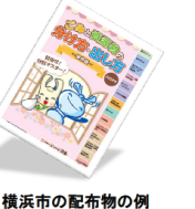
横浜市の配布物の例