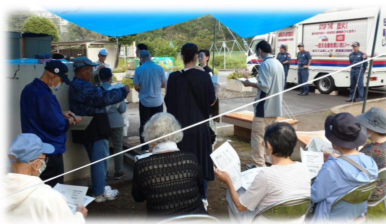
▲防災に関する心得を熱心に聞く自治会のみなさん

当公社、合わせて30名程が参加し防災訓練を行いました。震度7を体験したご入居者からは、「家具を固定することの重要性が分かった」、「棚の上にいろいろなものを置いているが、配置を見直してみる」などの感想が聞かれました。一方、子供たちはややアトラクション的な体験になったようですが、このような経験の有無は、いつかあるかもしれない災害時に役立ってくれると思います。