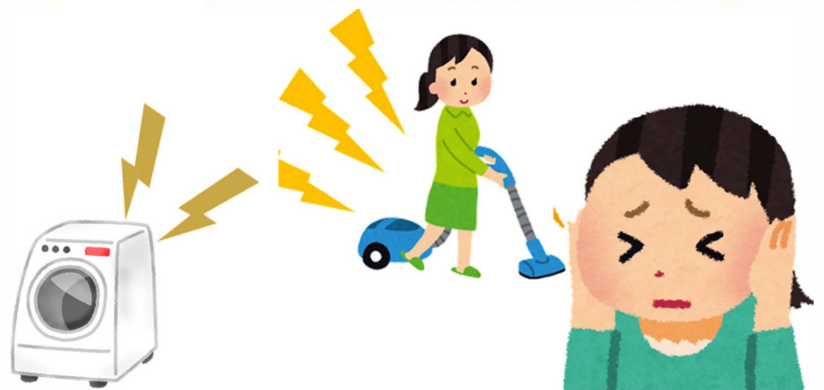
ຢ່າ ເປີດສຽງໂທລະພາບ ຫຼື ເຄື່ອງສຽງແຮງ

ຕອນເຊົ້າໆ ຫຼື ກາງຄືນ ຫ້າມຊັກເຄື່ອງ ຫຼື ຫ້າມໃຊ້ເຄື່ອງດູດຜຸ່ນ.