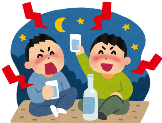
ຢູ່ໃນຫ້ອງ ລົມກັນໃຫ້ຄ່ອຍໆ

ມີໝູ່ມາຫຼິ້ນນຳເຮັດບາດີ, ຂໍໃຫ້ລົມກັນຄ່ອຍໆ