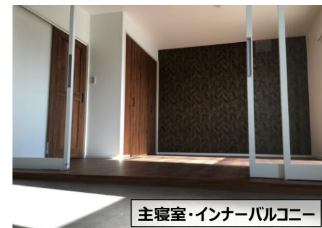
主寝室・インナーバルコニー