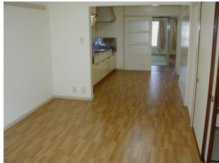
3LDK リビングダイニング